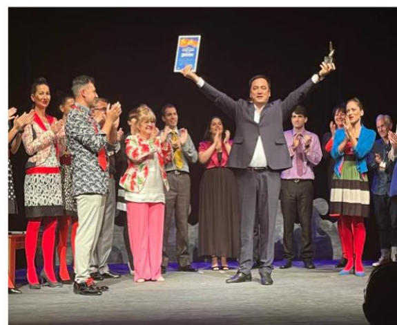
Фестивалът се осъществява с финансовата подкрепа на Министерство на Културата, Фонд Култура-Община Варна и Национален фонд Култура