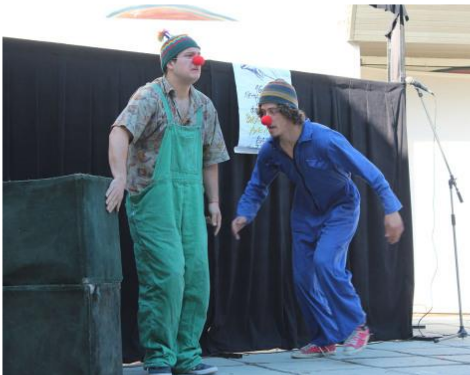
Куклы и клоуны-