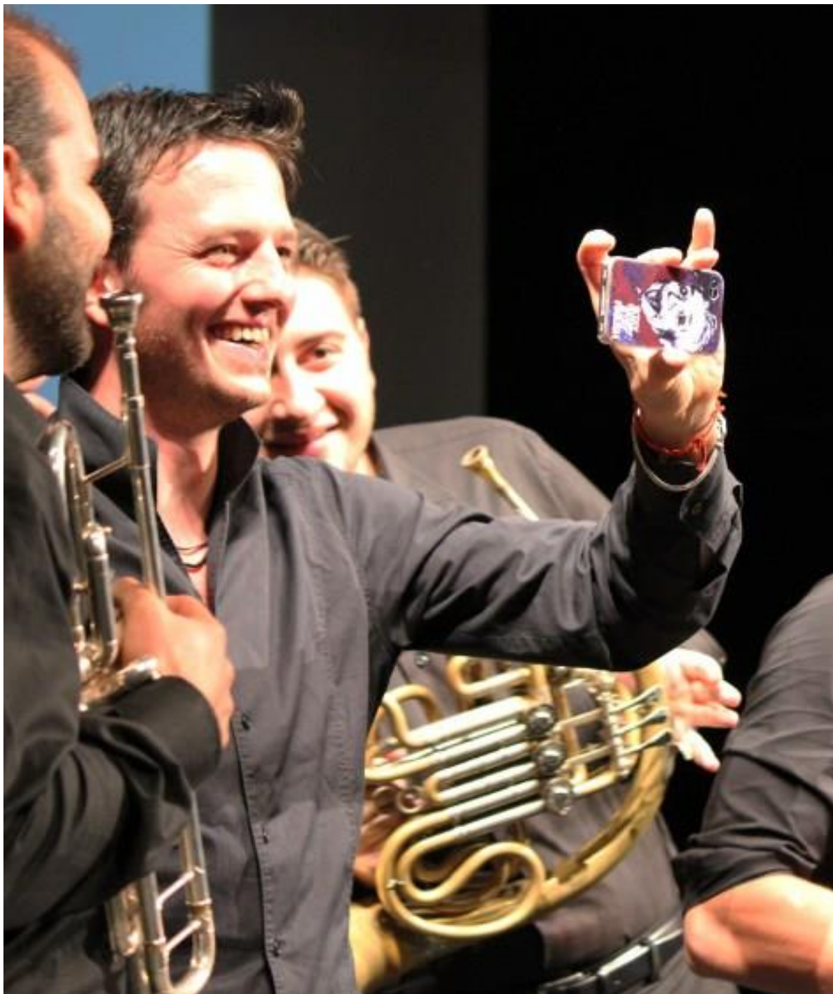
Билли Брасс Бэнд делают селфи на фоне экрана с Чарли в финале вечера.

И после окончания фильм-концерта ребята из бэнда бисовали минут 15, заставляя публику рукоплескать их попури из «Катюши», «Калинки-малинки» и пронзительных еврейских мелодий, устроив напоследок незабываемое брасс-шоу. Некоторые его моменты запечатлены на снимках в нашей галерее к этому посту. А что касается итогов фестиваля, о них — ниже.