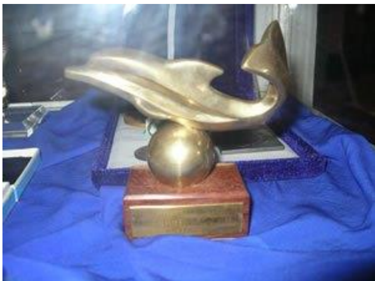
Гран При — статуэтка дельфина — в Музее Кукол Варны

160 спектаклей. Международная селекционная комиссия отобрала 15 лучших трупп, которые и будут состязаться за главную награду — статуэтку дельфина, в двух категориях: спектакли для детей и спектакли для взрослых .