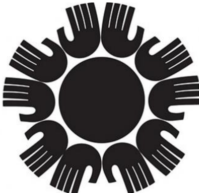
Логото на фестивала

1-7 октомври: XVI издание събира утвърдени трупи от 9 страни. Корея, Гърция, Франция, Португалия, Испания, Грузия, Италия, Израел ще се представят със свои куклени театри, а българските трупи са