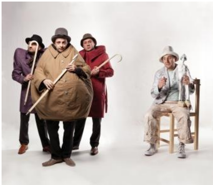
"Приказка за скитника-крал" на Столичния куклен театър