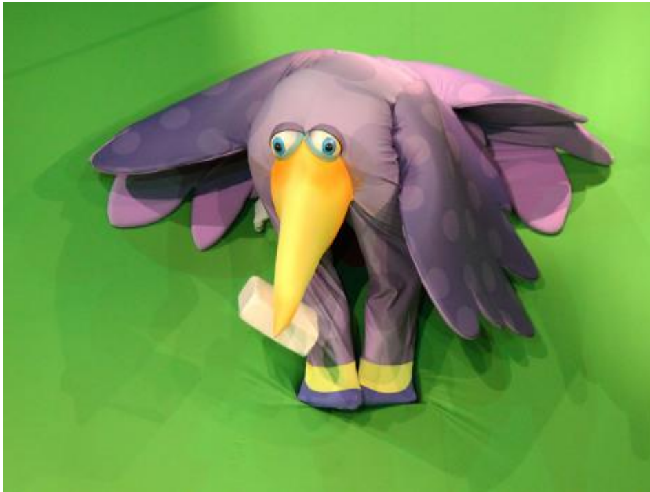
Ворона и Лисица-