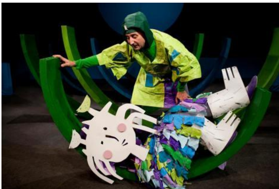
«Буря» Шекспира в версии Столичного кукольного театра из Софии

В честь 125-летия со дня рождения великого «маленького челоовка» Чарли Чаплина Культурная ассоциация «Умбри-А Кончерто» и Билли Брасс Бэнд из Перуджи (Италия), покажут на сцене Театра Кукол фильм-концерт «Чарли» с «живым» исполнением музыки Чаплина из фильмов «Тихая улица» и «Авантюрист». Это произойдёт дважды — перед вручением наград, вечером 6-го октября , и в последний день фестиваля, 7-го октября .