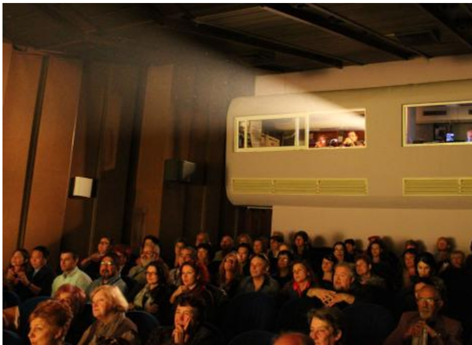
Зрители в зале

Комфортабельный зал театра заполнился под завязку очень быстро. По количеству установленных в проходах камер Национального Телевидения , репортеров с фотоаппаратами и руководителей различных культурных заведений города в креслах зала, сразу стало понятно, насколько большое значение придается этому событию в Варне. И действительно — старейший в Болгарии кукольный фест проводится только 1 раз в 3 года, и публика успела соскучиться по любимому зрелищу.