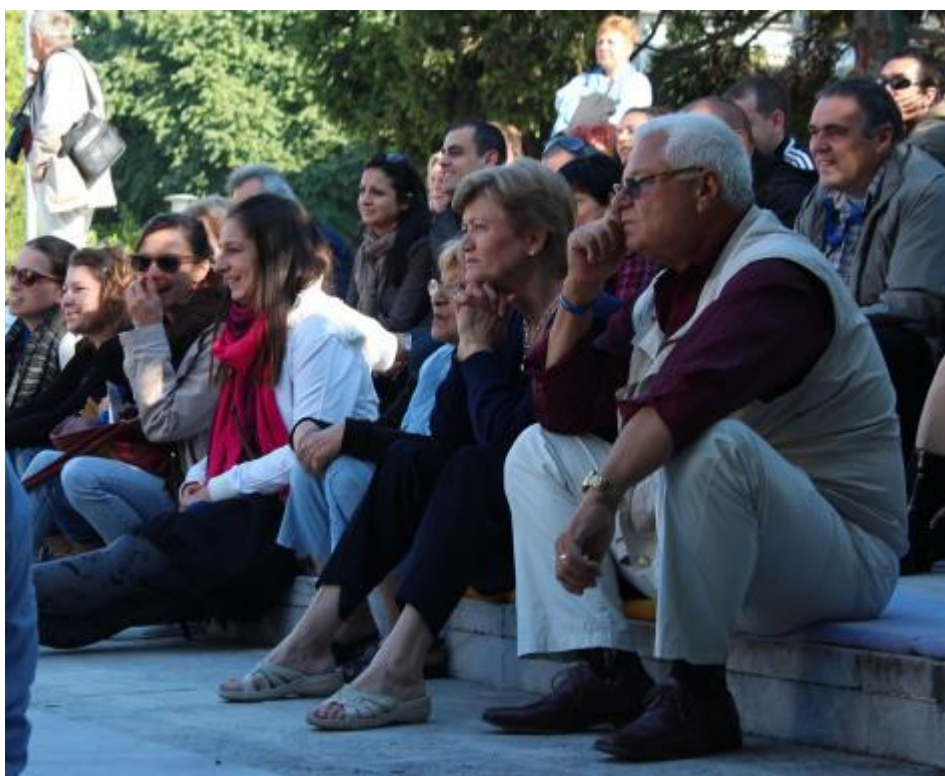
Зрители на летней

Из-за продолжительных аплодисментов восторженных зрителей и желания гостей фестиваля досмотреть спектакль до конца, буквально на несколько минут задержали церемонию открытия. Но никто не обиделся. Потому что и спектакль был хорош, и любители кукольного искусства сами по себе — народ веселый и доброжелательный.