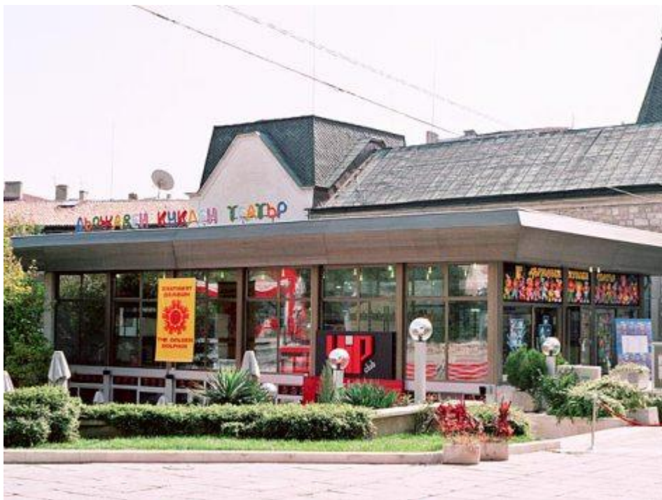
Кукольный театр -

Варна.