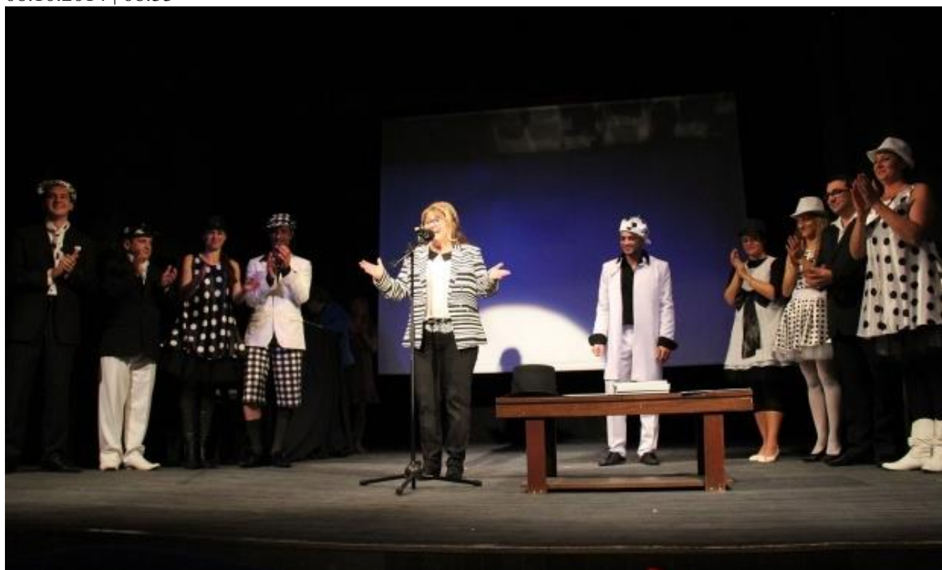
Снимка: "Златният делфин"

XVI Международен куклен фестивал "Златният делфин" връчи своите награди на тържествена церемония във Варна. С най-много отличия бяха присъдени на трупите на Държавния куклен театър във Варна и Столичен куклен театър.